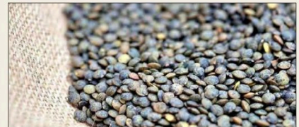
Les lentilles du Puy

• À Saint-Flour a été relancée la production de