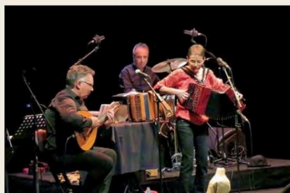
Revelhet animera le balèti

pour une grande part de façon orale qui promène l'imagination de l'auditoire sur les reliefs et dans les villages d'Ariège, sans oublier les petits cafés et bistrots qui balisent le chemin et fa-