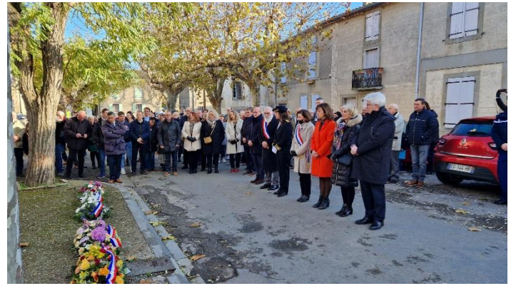
Un dépôt de gerbes en souvenir des quatre habitants qui ont perdu la vie lors des inondations d'octobre 2018.