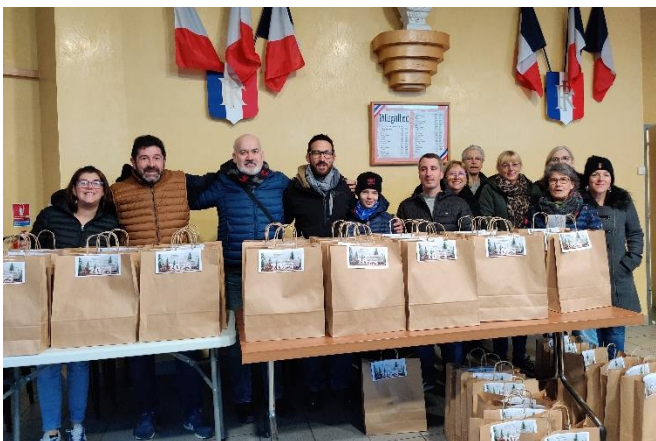
L'équipe municipale prête pour la distribution aux aînés

Pour la troisième année consécutive, le maire et son équipe municipale ont offert pour les fêtes de fin d'année, un panier gourmand aux personnes de 70 ans et plus de la commune. Dernièrement les élus ont frappé aux portes des 220 foyers concernés pour remettre ces colis préparés avec soin depuis plusieurs semaines. Un petit moment de convivialité et d'échanges autour de cette attention appréciée par tous les aînés du village à la veille de Noël.