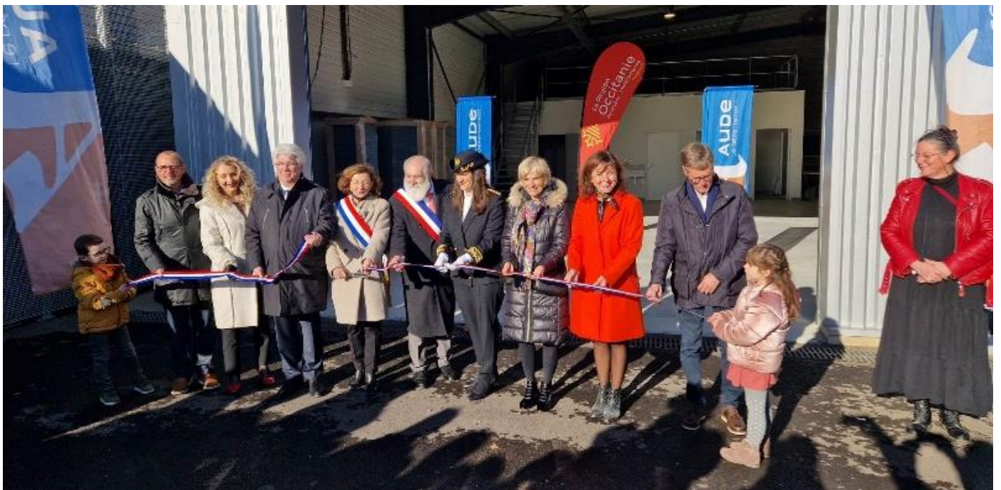
Les habitants étaient eux-aussi invités et ont participé nombreux à ces manifestations.