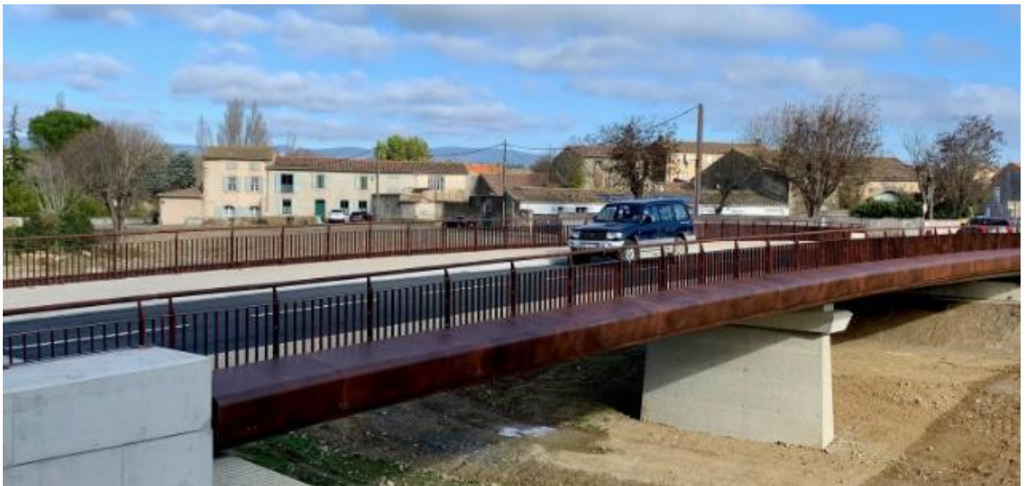
Inauguration du nouveau pont sur le Trapel en présence de nombreuses personnalités et avec la participation du 3 ème RPIma