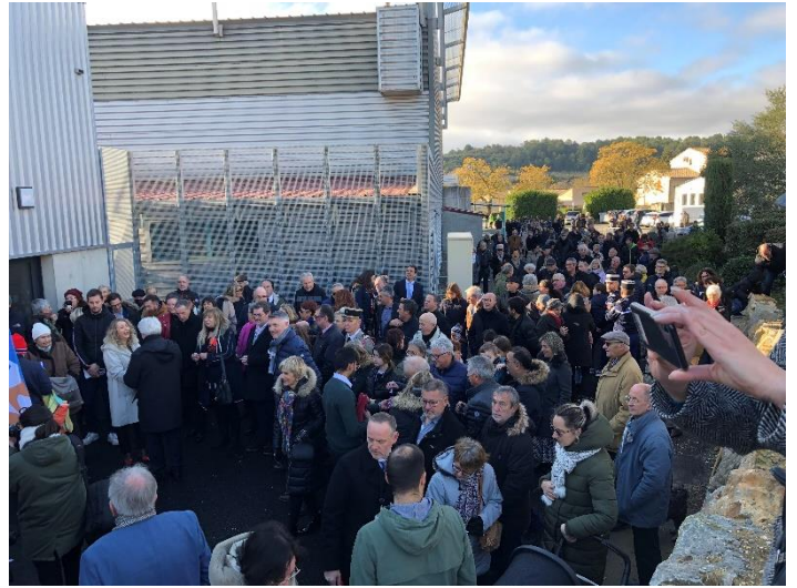
Inauguration de la maison citoyenne, puis du nouveau foyer et enfin des ateliers municipaux.